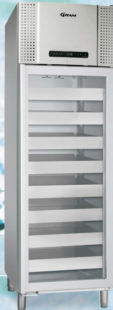
BioPlus 660D. Schubladen sowie Glastür sind optional als Zubehör erhältlich.

Verfügbar mit weißem Gehäuse oder aus Edelstahl, mit isolierter Glastür oder Massivtür.